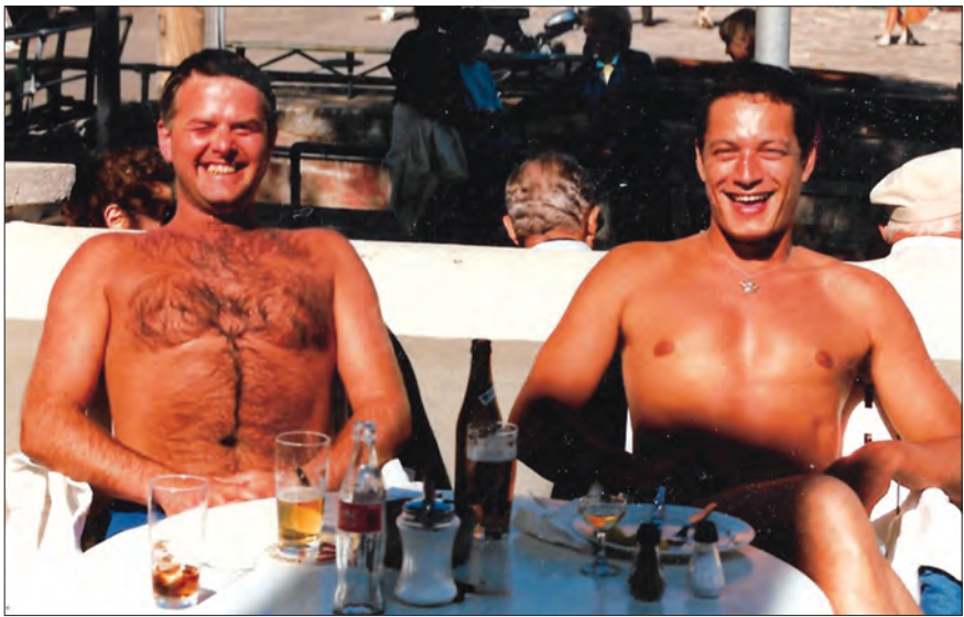
Frimands Quarteer og Palæ Bar holdt fælles personaleudflugt til Bornholm. Værtshusejerne nyder sommer og sol i Café Klints gård.